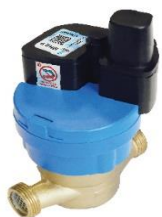
ВСКМ МИД Р