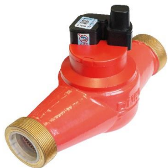
ВСКМ 90 МИД Р