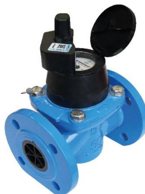
СТВХ «СТРИМ» МИД Р