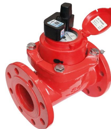
СТВХ/СТВУ МИД Р